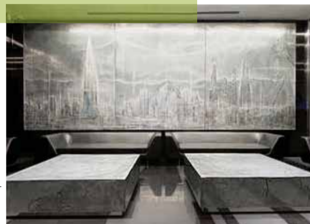
Gazprom Neft Business Center, San Pietroburgo, 2013. (in basso)