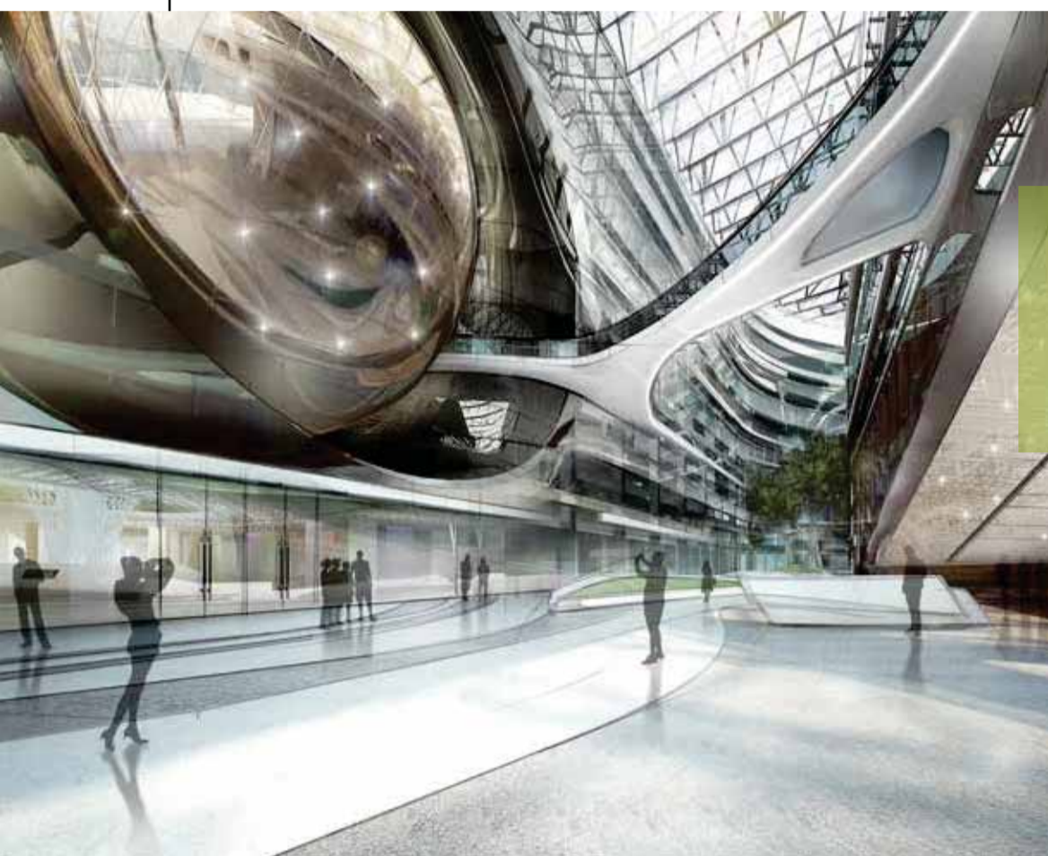
Spazi pubblici del Lakhta Center, San Pietroburgo, in progress. (a sinistra)